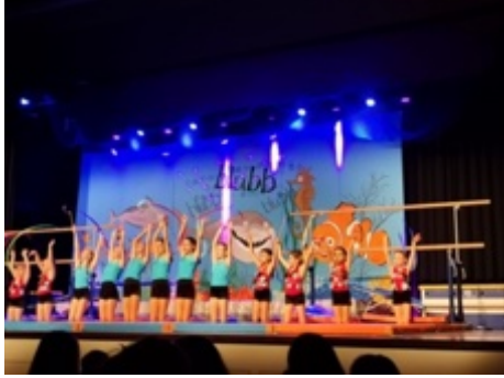
Kurz vor Kränzle-Auftritt 2019 Parat für den Auftritt