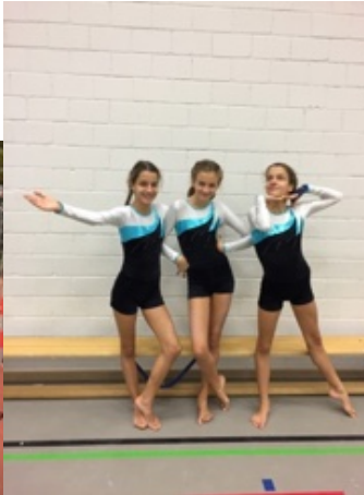
K4: LLM Balzers 14.09.2019