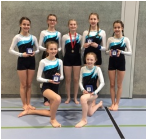
K4: Unterländercup 23.03.2019