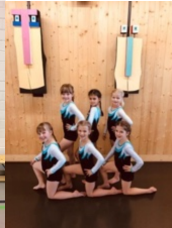
K1: KB Cup Sargans 19.05.2019