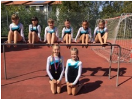
K1 und K2: LLM Balzers 14.09.2019